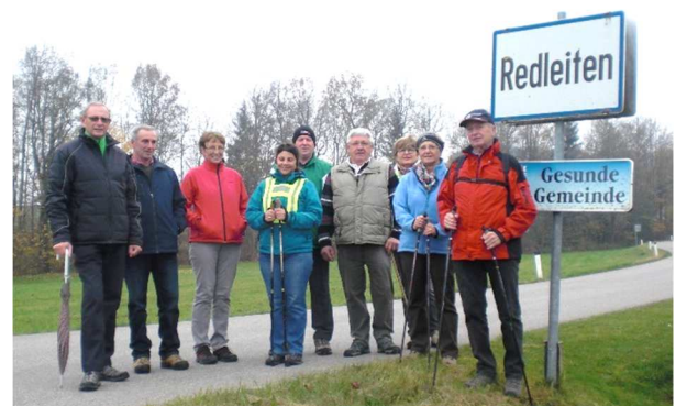
Die fleißigen 50+Wanderer

Mehr Fotos finden Sie auf der Homepage der Gemeinde Redleiten unter www.redleiten.ooe.gv.at