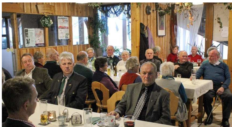
Tag der Senioren 2017