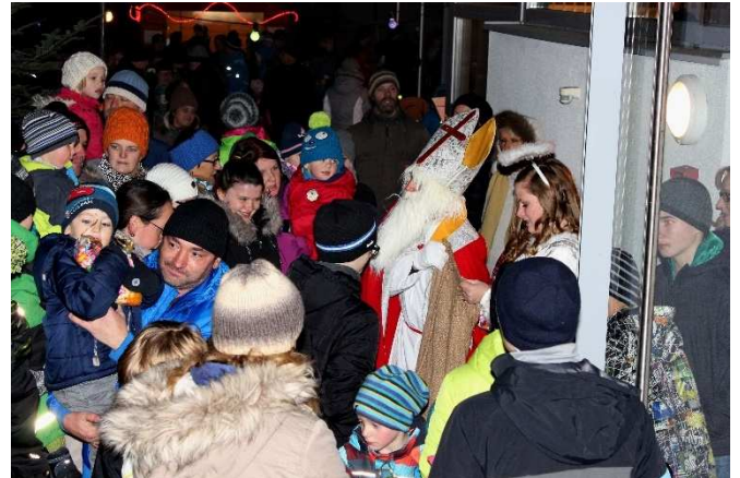
Redleitner Advent 2017

ES GEHT NICHT DARUM, WAS UNTER DEM WEIHNACHTS- BAUM LIEGT, SONDERN WER DRUM HERUM STEHT.