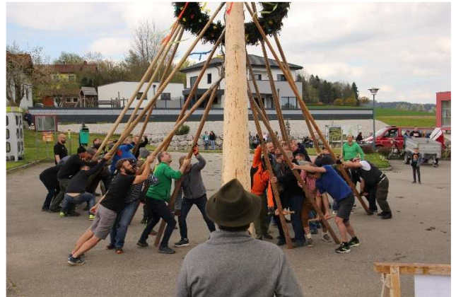
Ein Danke an die Kameraden der FF Redleiten, die diesen alten Brauch aufrecht erhalten.

Beim Gemeindeamt wurde heuer wieder einmal ein Maibaum von der Feuerwehr aufgestellt. Sowohl beim Aufstellen als auch bei der Verlosung waren viele Zuseher und Helfer mit dabei.