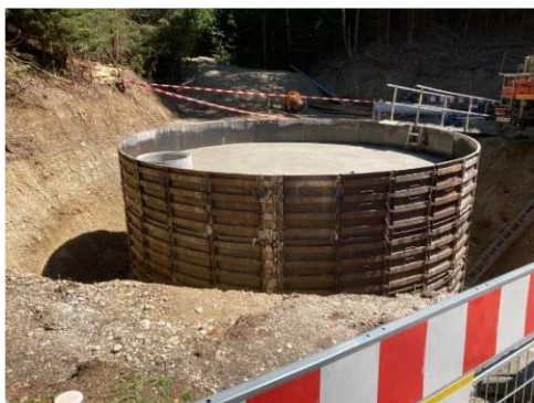
Löschteichbehälter im Redltal

Auch einige Anschaffungen haben wir 2023 getätigt. Ein Notstromaggregat für das Amtsgebäude wurde angekauft, neue Bänke für den Sportplatz, ein Löschbehälter im Redltal wurde errichtet und eine PV-Anlage mit Speicher wurde am Feuerwehrhaus installiert.