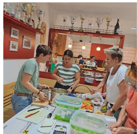
Fermentierkurs der Gesunden Gemeinde

Dafür ein großes Lob und Dank meinerseits.