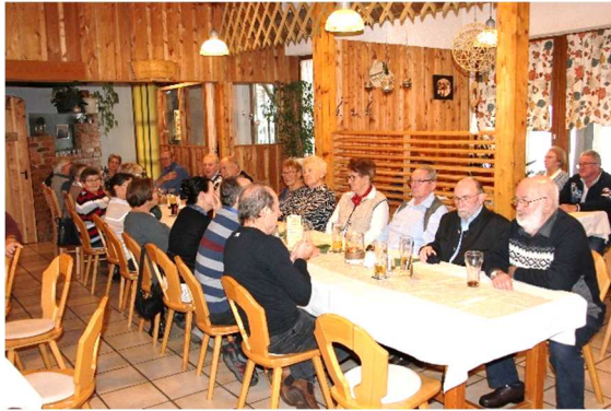
Tag der Senioren 2023

Im Herbst war ein sehr informativer Vortrag zum Thema „Blackout“ im Gemeindesaal mit ca. 30 Besuchern und die Jungbürgerfeier sowie der Tag der Senioren fanden im Gasthaus Adambauer statt. Beide Veranstaltungen waren gut besucht, was mich sehr freute.