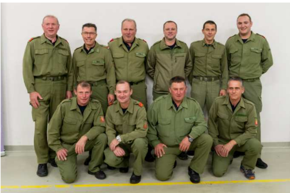
i. B.: Bewerbungsgruppe Redleiten 1

Mit zwei Urkunden wurde unsere Bewerbungsgruppe für die erbrachten Leistungen beim Bundesbewerb in St. Pölten - 3. Rang in Silber und Bundessieger in Bronze - geehrt!