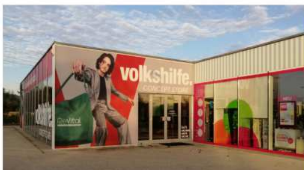
Der neue ReVital Concept Store in Timelkam

Typische ReVital-Produkte sind Elektrogeräte, Sport- und Freizeitgeräte, Hausrat, Möbel oder Spielsachen .