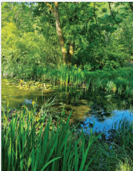
Teich im Botanischen Garten

Etwa 50 Ehrenamtliche aus den Vereinen und als Privatpersonen pflegen ihre Bereiche auch schon vor Ostern und die ganze Saison über, aber am Aktionstag ist wirklich viel los. Da können auch größere Arbeiten mit Hilfe des Bauhofs durchgeführt werden. Werkzeug, soweit es nicht vorhanden ist, bitte mitbringen.