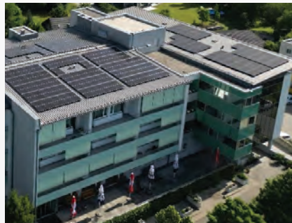
PV am Dach des Altenheimes.

PV-Anlagen wurden auf dem Dach des Altenheims und am Dach des neuen Schulzentrums, hier mit einem Speicher, errichtet.