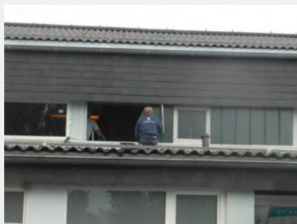
Fenstertausch im Kulturzentrum

Im Kulturzentrum wurden auf der Südseite die Fenster getauscht und der Elektroverteiler erneuert.