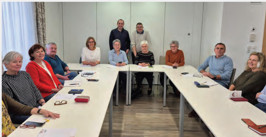
Einige Teilnehmer des 1. Handykurses

Achtung begrenzte Teilnehmerzahl: Anmeldung im Bürgerservice unter 07683-5006