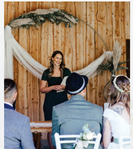
Auswärtstrauung beim PreunerWirt

Unsere Mitarbeiterinnen am Standesamt informieren Sie gerne über alle Möglichkeiten von standesamtlichen Trauungen in Frankenburg.