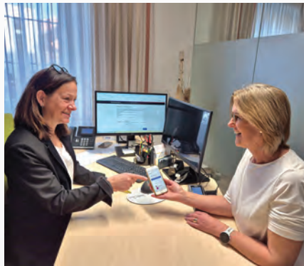
ID Austria am Bürgerservice

Im Bürgerservice unterstützen wir Sie rund um die ID Austria nicht nur bei der Registrierung (dafür notwendig: Smartphone und gültiger Reisepass). Auch bei Fragen zur Anwendung, bei technischen Problemen oder Unklarheiten helfen wir Ihnen gerne. Bitte einfach zu den Öffnungszeiten oder nach Terminvereinbarung vorbeikommen! Mo - Fr 07:30 - 12:30 Uhr Di zusätzlich 14:30 - 17:30 Uhr