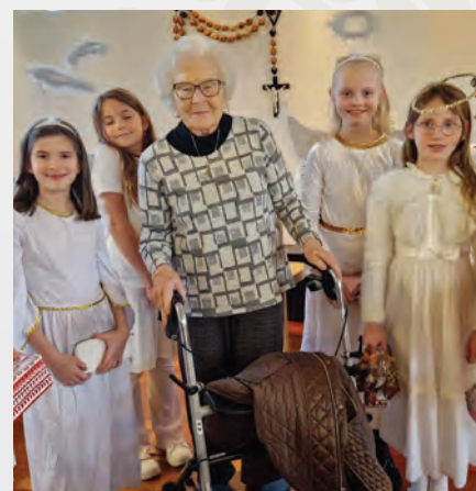
Advent im Altenheim

Volksschule Frankenburg Hauptstraße 29 ☎ 07683 8286 s417131@schule-ooe.at