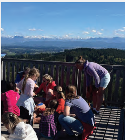
Eierpeck'n am Gölblberg

Ob Groß oder Klein – bringt eure schönsten Ostereier mit, genießt die herrliche Aussicht und verbringt einen gemütlichen Nachmittag in geselliger Runde. Diese liebgewonnene Tradition ist jedes Jahr ein fröhlicher Treffpunkt für Familien, Wanderfreunde und alle, die gerne gemeinsam lachen und feiern.